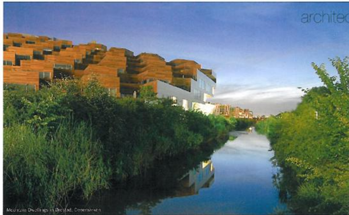
Mount Dwellings in Den Haag, Omschreven