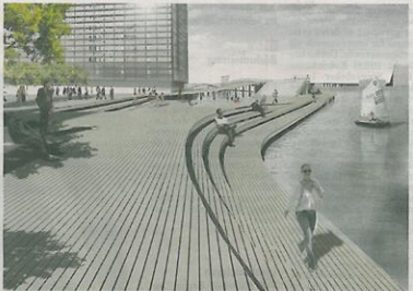
En beløgende promenade. I sin udformning minder Kalvebod Brygge om Havnebadet og Det Maritime Ungdomshus.

En samlet plan for hele Kalvebod Brygge burde som mindst mulige forelægge som grundlag for en stillingtagen til, om Kalvebod Bølge er den rigtige løsning, eller om der findes mere relevante alternativer, eksempelvis langs andre strækninger af Kalvebod Brygge, hvor der vil være et publikum til at betjene sig af i tilbud, der stilles til rådighed.