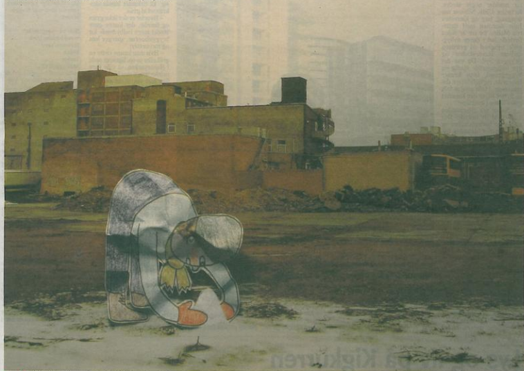
Fotocollage fra Islands Brygge Syd af HuskMitNavn fra 2007.

Den anonyme gadekunstner HuskMitNavn har givet liv til Bryggens efterladte steder og midlertidige rum med sine karakteristiske tegneseriefigurer. Slidte facader og nedlagte fabrikker har fået en tur med spraydåsen, og øde områder er blevet befolket af små papirfigurer. En papirfigur kigger forundret til, mens murbrokkerne falder ned omkring A-huset. En anden bygger stilerdygtigt et lille bjerg af sne på en tom byggeplads, og to punkertyper hænger ud på det gamle vaskeri på Njalsgade.