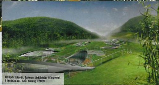
Bølger i Ao-ai, Taiwan. Arkitektur integreret i landskabet. Sår lært ig 2009.