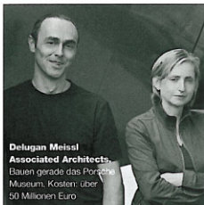
Delugan Meissl Associated Architects. Bauen gerade das Porsche Museum. Kosten: über 50 Millionen Euro

Hauptbahnhof Stuttgart. Nach dem prestigeträchtigen neuen Hauptbahnhof in Berlins Mitte könnte die Bahn mit dem Projekt „Stuttgart 21“ eine weitere wegweisende Station erhalten. Die Fernbahntrassen, die bislang in dem alten Sackbahnhof endeten, sollen tiefergelegt werden. Die unterirdischen Gleise bekommen, so die Pläne, ein grünes, öffentlich begehbare Dach übergestülpt, das den heiteren Schlossgarten mit dem Stadtzentrum verknüpfen wird. Für diesen grünen Deckel hat das Düsseldorfer Büro Ingenhoven Architekten eine Lösung von fesselnder Eleganz und raffinierter Kühnheit vorgesehen: Als futuristisches Gewölbe ruht die Dachplatte über dem unterirdischen Bahnhof. 28 ovale und verglaste Deckenöffnungen belichten und belüften den unterirdischen Terminal auf natürliche Weise. Für Heizung, Kühlung und Beleuchtung wird keine Energie benötigt, insofern ist der Bahnhof ein Null-Energie-Gebäude. Ingenhoven Architekten wurden schon mehrfach für ihre ökologischen und nachhaltigen Projekte ausgezeichnet. „Stuttgart 21“ erhielt unter anderem den Global Holcim Award 2006. Der Holcim Award ist ein globaler Wettbewerb für nachhaltiges Bauen. www.ingenhovenarchitekten.de