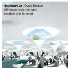
Stuttgart 21. Ovale Deckenöffnungen belichten und belüften den Bahnhof

Etwas ähnliches Spektakuläres plant man auch in Oslo. Das dänische Architekturbüro JDS Architects entwarf die neue Skisprungschance am Holmenkollen. Besonderheit: Eine transluzente und abends hinterleuchtete Glaswand führt von der Turmspitze über den Aufsprunghang bis hin zum Zieleinlauf. Publikum und Sportler sollen auf diese Weise zu einer emotionalen Einheit verschmelzen. Die Schanze wird schon heute als neues Wahrzeichen von Oslo gehandelt. Die Fertigstellung ist für das Jahr 2010 geplant. www.zaha-hadid.com , www.jdsarchitects.com