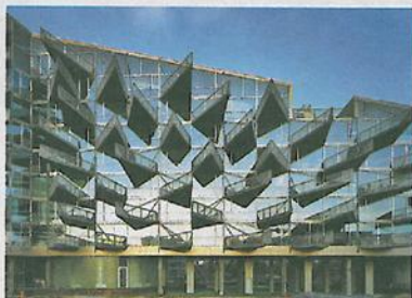
HATTENNER: Julien De Smedts og Bjarke Ingels prisbelønte boligbygg i Ørestaden syd for København.