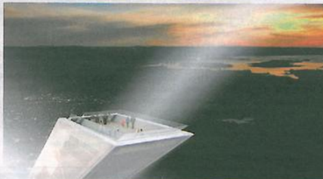
BAKKEN & BYEN: Oslos festes- teakterasse skal ligge på toppen av den nye Holmenkollbakken og er ment å ivareta den kommunikasjonen som i alle år har eksistert mellom byfolket og bakken. Illustrasjon: JDS Architects.

bruck, så kunne jeg prøve meg på Holmenkollen. Som arkitekt er vi ikke spesialister inn mot ett felt, men vi er veldig gode til å lytte, sier Julien De Smedt.