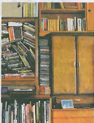
Bokglad: Favoritten er «Neuromancer» av William Gibson.