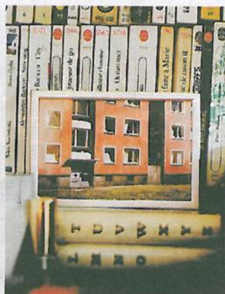
Allt i ett: Smått og stort er samlet i bokhylla.