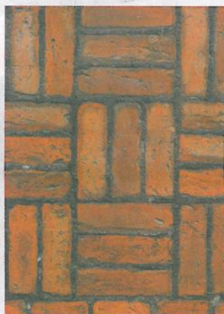
Stein på stein: Detalj fra bygården til de Smedt.