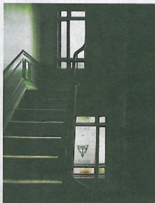
Oppgang: Det meste har gått oppover for belgieren.