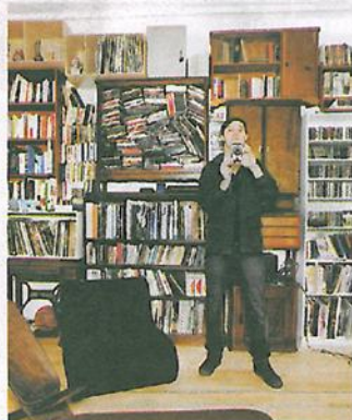
Knips: Den fotograferte tar bilde av fotografen. Eller er det omvendt?