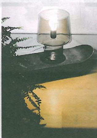
Skater: Det gamle skateboardet er blitt til bord.