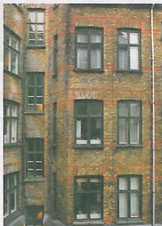
Ut av sentrum: Heller bygård i Frederiksberg.

De Smedt har sendt inn 12-13 forslag i norske arkitektkonkurranser som ikke har blitt noe av. Foreløpig er butikken Bruuns Bazaar i Oslo eneste