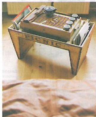
Suvenir: Tradisjonelt kinesisk tesett kjøpt i Taiwan.

– Jeg liker best prosjekter i stor målestokk, da er det mer masse å leke med.