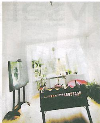
Så lyset: De Smedt falt for lyset i leiligheten.