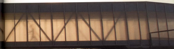
фото предоставлено текст Жена Бхтурова

заказчик Ellsinore psychiatric clinic архитекторы PLOT = BIG + JDS